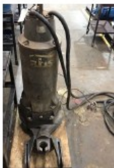
Imagem referente ao registro do estado físico em que se encontra o equipamento quando da entrada.