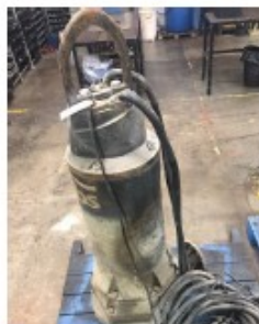
Imagem referente ao registro do estado físico em que se encontra o equipamento quando da entrada.